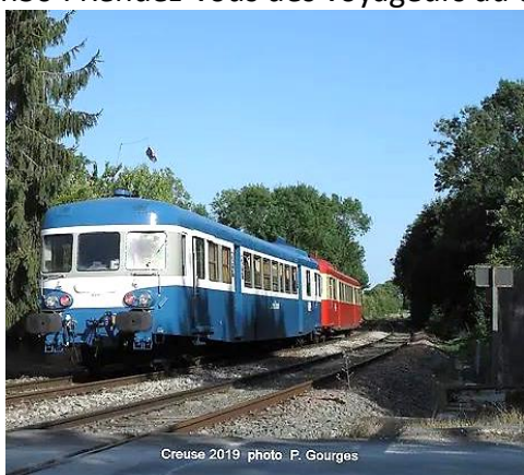
X 2800 de l'Autorail Limousin Creuse 2019