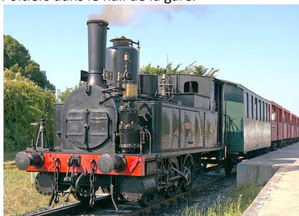
Train des Mouettes, loco 030-T "Progrès" à La Tremblade