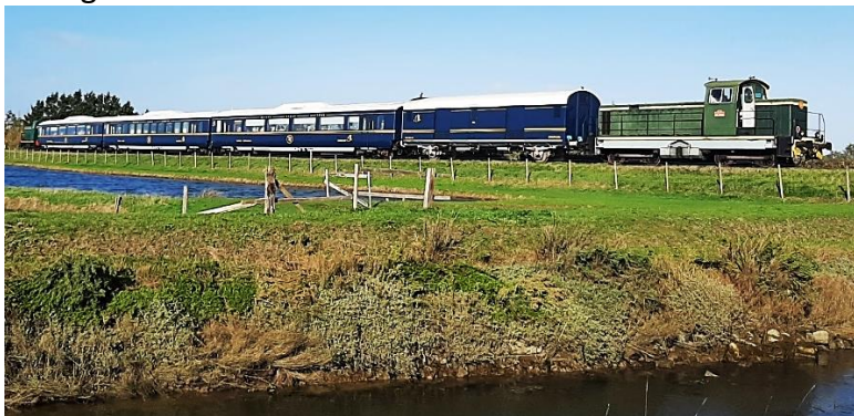
Seudre Océan Express Novembre 2022 - © Train & Traction