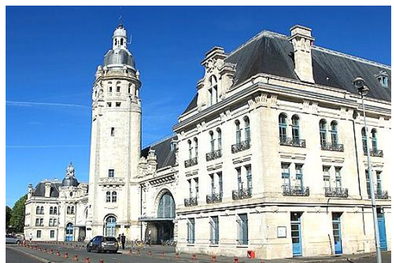
Gare de La Rochelle-Ville, vu côté parvis